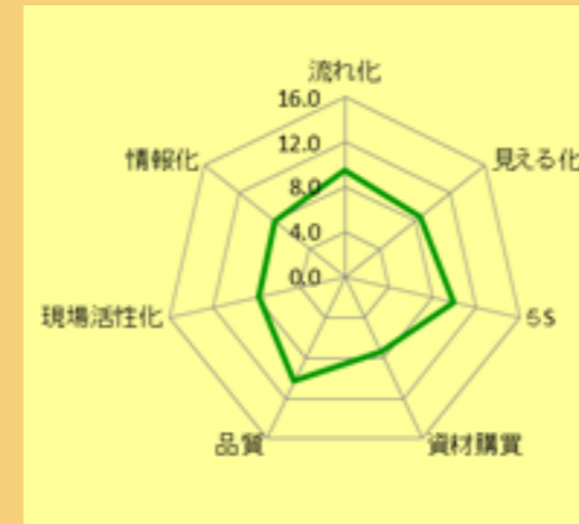
7項目全企業平均値